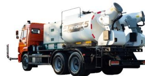
Оборудование для пылеподавления