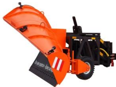
Навесное на КДМ